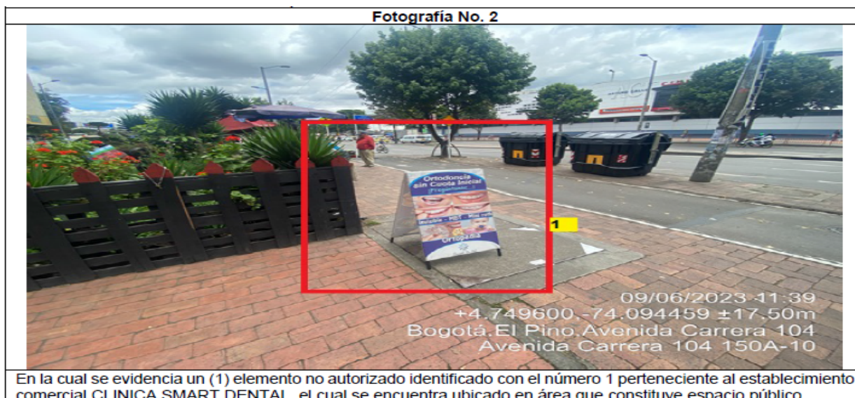
Fotografía No. 2